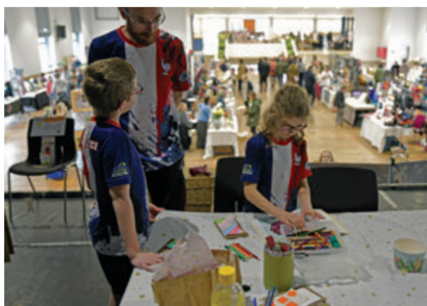
Marché des créateurs et des artisans d'art, le 17 mars.