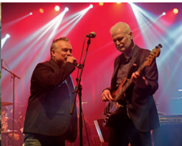
Les Mauvaises Langues en concert, le 22 mars.