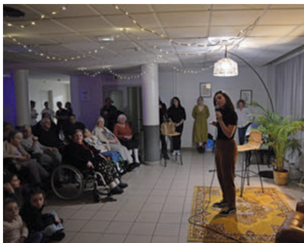
Spectacle de stand-up à la résidence des ogiers, le 21 mars.