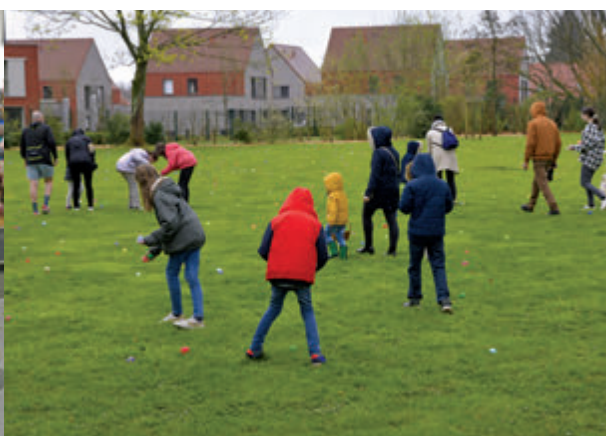
La Chasse aux oeufs, le 30 mars.