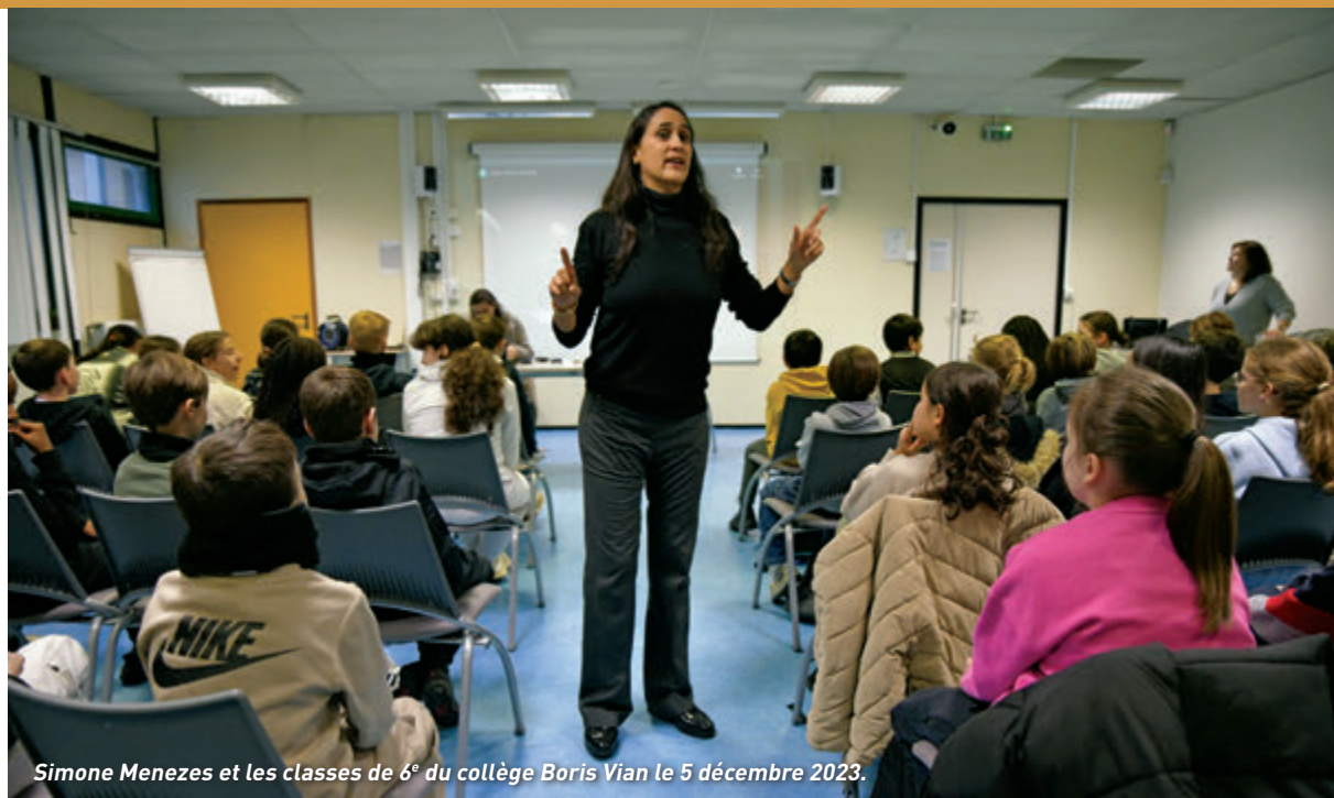
Simone Menezes et les classes de 6 e du collège Boris Vian le 5 décembre 2023.

C'est une belle invitation qui est proposée le 31 mai au nom évocateur « le Jardin » mais aussi et surtout auréolée de sens, d'inclusion, d'ouverture concrète et vivante sur la culture, en l'occurrence la musique. Sur scène, des artistes de renommée internationale aux côtés de jeunes d'une douzaine d'année ! La soirée marque, en effet, l'aboutissement d'une rencontre entre une cheffe d'orchestre Simone Menezes, mondialement connue et les élèves de 6 e du collège Boris Vian sous la houlette de leur professeur de musique Stéphane Meunier.