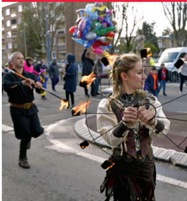
Le carnaval, le 23 mars.