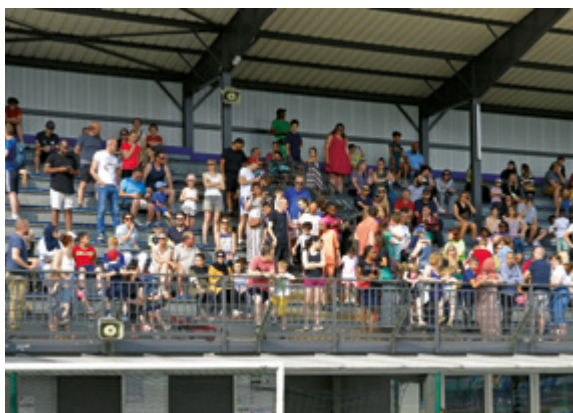
► Rénovation des vestiaires, tribunes et équipements liés à la pratique du football au campus Seigneur