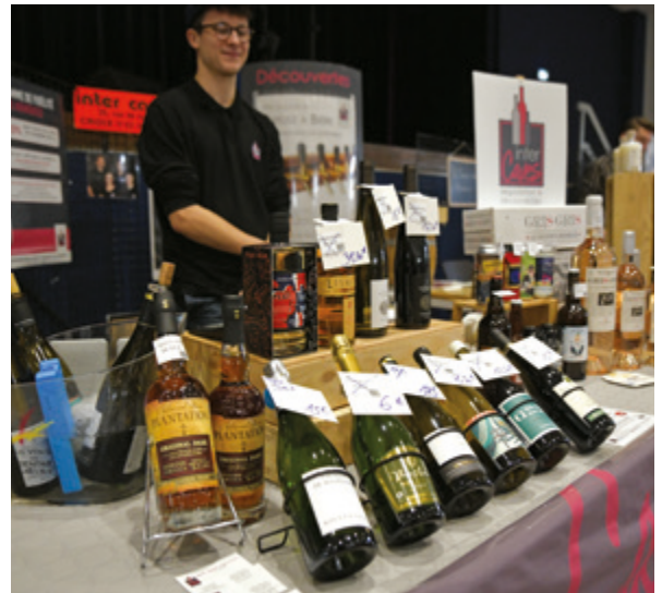
Le salon de la Gourmandise et des vigneron les 29, 30 septembre et 1 er octobre