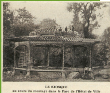
LE KIOSQUE au cours du montage dans le Parc de l'Hôtel de Ville

Le kiosque lors de son remontage dans le parc en 1934.