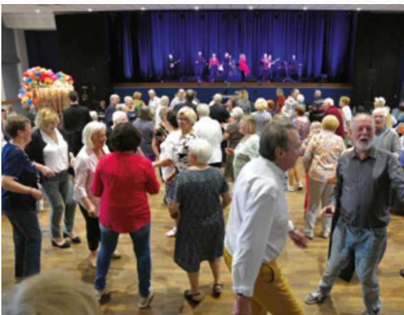
Banquet des aînés le 4 octobre