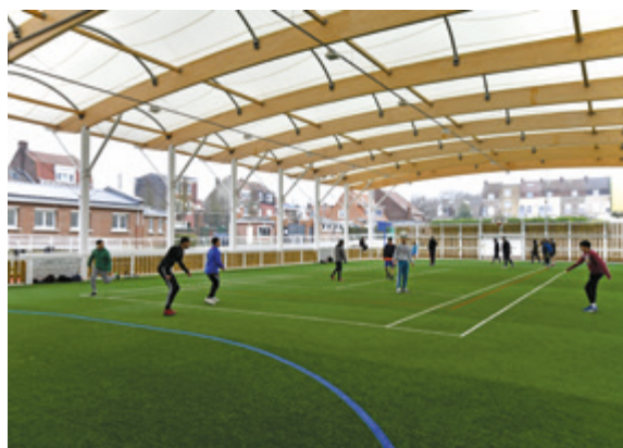
► Construction d'un terrain multisport couvert en 2019