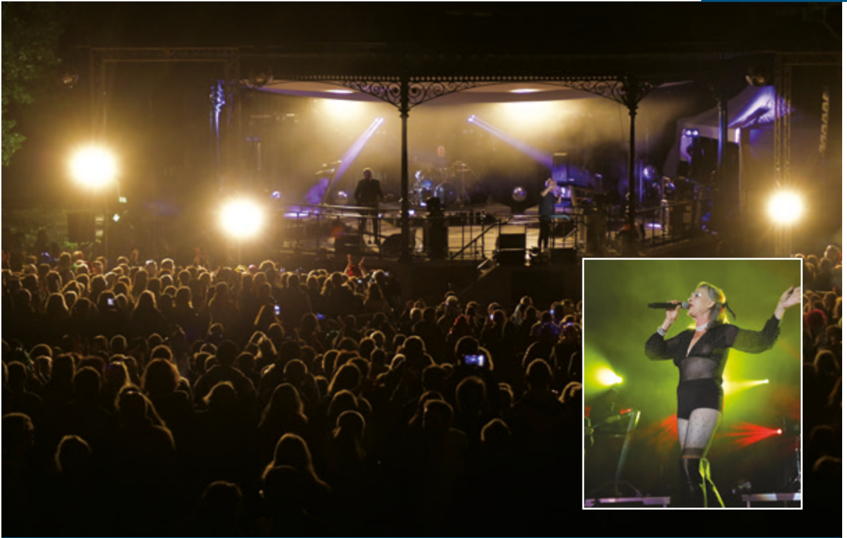
La fête du kiosque 23 septembre.