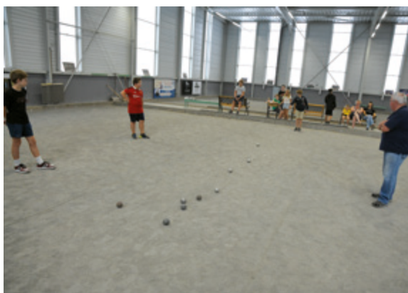
► Construction d'un boulo-drome de 32 pistes en 2018