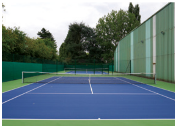
► Engagement des travaux au Tennis Club des Flandres, devenu propriété de la ville en août 2022