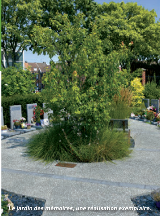
Le jardin des mémoires, une réalisation exemplaire.