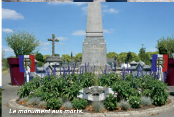
Le monument aux morts.