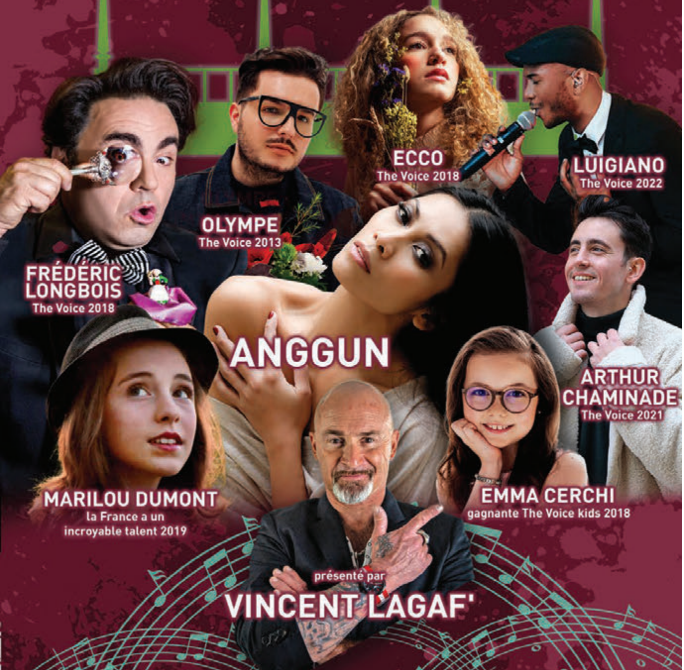
FRÉDÉRIC LONGBOIS The Voice 2018