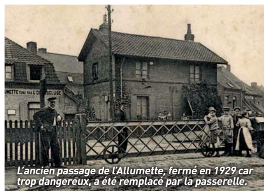
L'ancien passage de l'Allumette, fermé en 1929 car trop dangereux, a été remplacé par la passerelle.

provisoire sera créé côté rue des Ogiers pendant la dépose de la passerelle existante et la réalisation de l'escalier définitif. Les informations plus précises seront diffusées dès leur obtention.