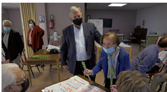
Symbole du bonheur, le muguet a été offert dans les résidences de personnes âgées. Plus tard, c'est du chocolat que les aînés ont pu déguster à l'occasion de la fête des pères et des mères. 2 mai et 9 juin.