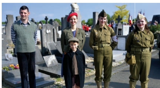
Présence remarquable de l'association Jeep Club des Flandres à la cérémonie du 8 mai en hommage aux victimes du conflit de la 2 e guerre mondiale. 8 mai.