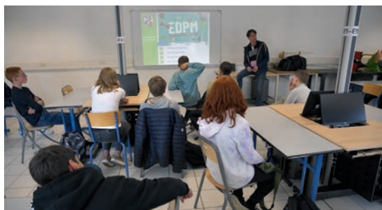
Journée de la sécurité routière. Toutes les classes de 5 e et de 3 e du collège Boris Vian ont été sensibilisées aux dangers de la route au travers de divers ateliers. 6 mai.