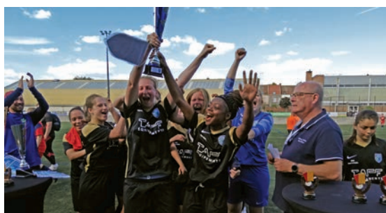
Bravo aux féminines de l'Iris Club de Croix, vainqueurs de la coupe des Flandres ! 12 juin.