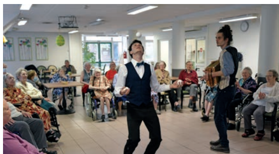
Culture aux fenêtres est un dispositif de département permettant aux aînés de profiter d'animations artistiques et, ainsi, de lutter contre l'isolement. Nos résidences ont accueilli le groupe de musique latine « Quija Trio » et les jongleurs du cirque de Lomme. 28 avril.