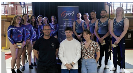
La Patriote a félicité ses équipes de filles et garçons pour leur parcours en championnat. 18 mai.