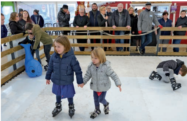
Comme l'année dernière, la patinoire, installée place de la liberté, en collaboration avec le comité de quartier Croix Saint-Pierre a remporté un vif succès.