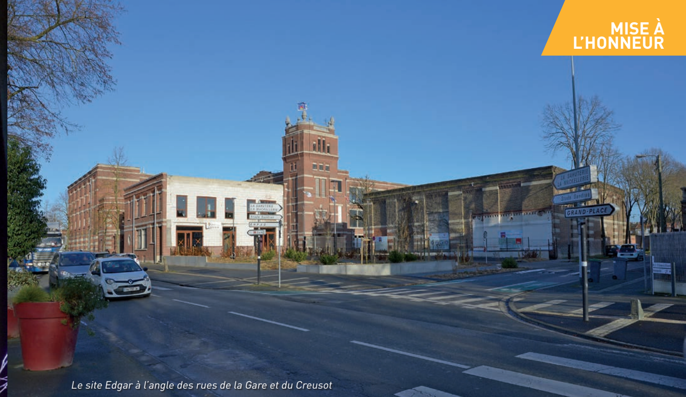
Le site Edgar à l'angle des rues de la Gare et du Creusot