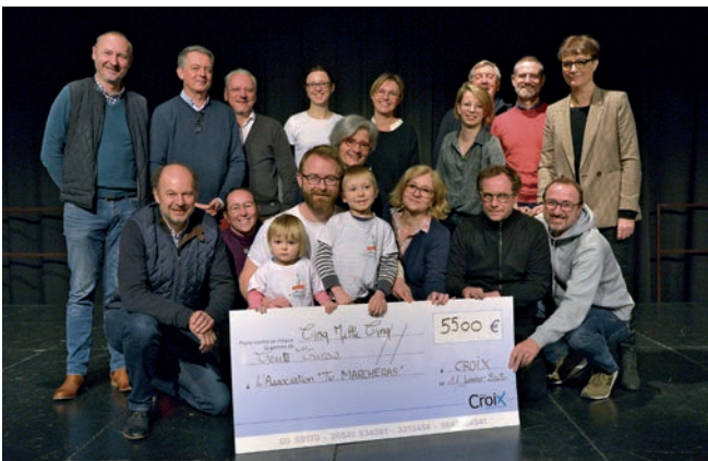
Le succès du festival de théâtre « Croix sur scène » a permis de reverser 5 500 euros à l'association caritative « Tu marcheras ».