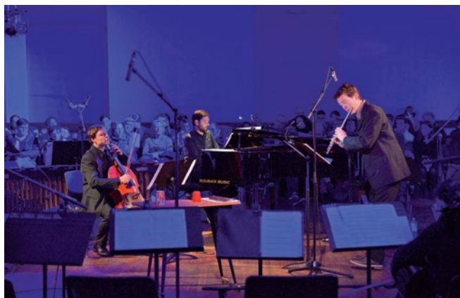
Des tributes dans des genres différents : du jazz pour un tribute minimaliste avec des élèves du conservatoire de musique et le trio Espace Impair ; les succès de U2 et Depeche Mode réunis sur la scène de la salle Jacques Brel.