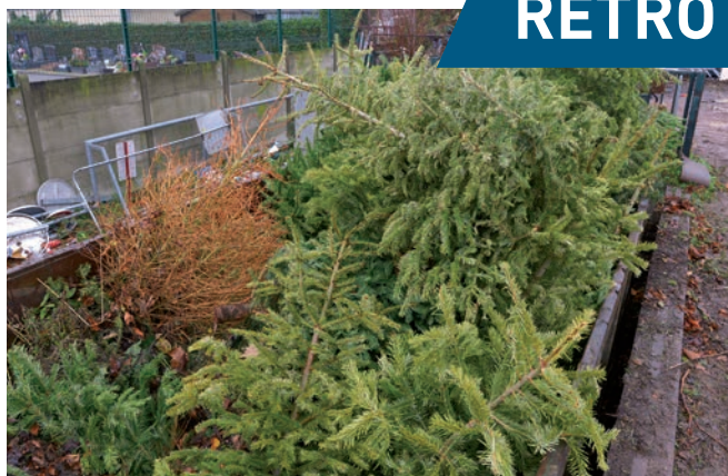
Les sapins, récupérés après les fêtes par les services techniques de la ville, sont devenus du compost.