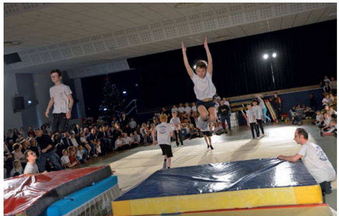
Les nombreux licenciés du club de gymnastique de la Patriote ont passé un après-midi festif lors de leur gala pour clore l'année 2019.