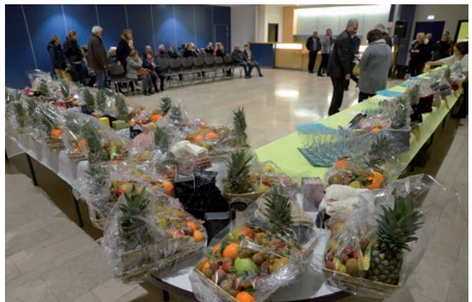
Les animations de Noël sur les cinq marchés de Croix ont fait gagner des paniers garnis, offerts par les commerçants non sédentaires.