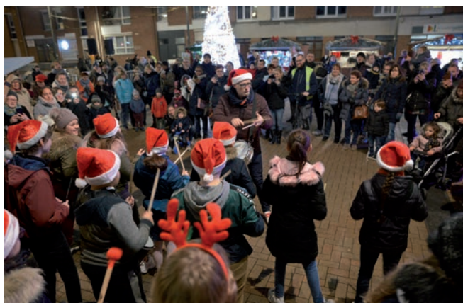
Le marché de Noël et ses différentes animations ont égayé le centre-ville, en cette fin décembre.