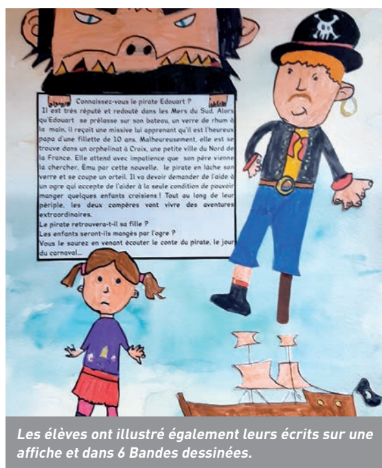
Les élèves ont illustré également leurs écrits sur une affiche et dans 6 Bandes dessinées.

S amedi 21 mars, le Carnaval va animer les rues de Croix. De son lieu de départ, place de la Liberté, au Parc de la mairie où le bonhomme hiver sera brûlé comme la tradition le veut, les confettis vont virevolter autour des chars et des carnavaleux ! Cette année, le thème est : « la fille du pirate et l'ogre », basé sur un conte, écrit par les élèves de la classe de CM1 /CM2 de monsieur Dewevre de l'école Jean Zay. L'histoire des enfants lancés dans cette aventure, a démarré par la participation à un jeu d'écriture, organisé par la MJC. Répartis en six groupes, les apprentis auteurs ont élaboré divers scénarios. Au départ, un personnage, tiré au sort : l'ogre, le pirate, l'indienne, l'inspecteur, la fée, l'extraterrestre. Ensuite, comme au jeu de l'oie, ils ont agrémenté l'histoire par les événements que commandait la case sur laquelle les dès les amenaient, imaginant un obstacle, une rencontre... L'ensemble a été étoffé et amélioré en classe. Qui plus est, avec l'aide d'un intervenant, six bandes dessinées ont été réalisées comme autant de contes écrits. La MJC et les co-organisateurs du carnaval ont choisi, l'histoire du pirate comme étendard du carnaval dans son édition 2020.