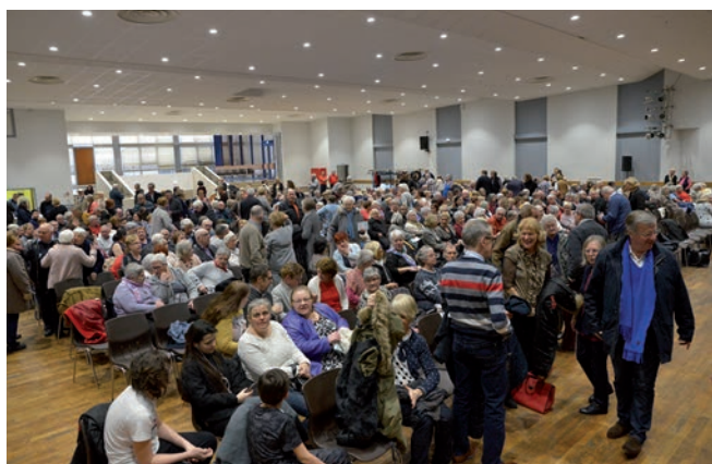
Très bonne ambiance au spectacle des aînés. Les airs connus, les costumes, les chorégraphies, les paillettes de Clo-clo ont enchanté un public nombreux et enthousiaste.