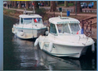
Bateaux de Formation MER / RIVIERE

Email : permisgrandlarge@orange.fr www.Lille-permis-Bateau.com