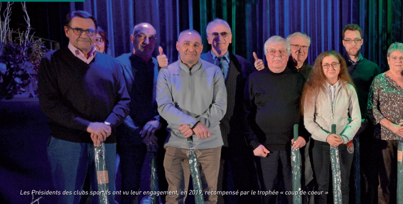
Les Présidents des clubs sportifs ont vu leur engagement, en 2019, récompensé par le trophée « coup de cœur »

La remise des récompenses aux sportifs et bénévoles est traditionnellement organisée au mois de janvier. Si elle a pour objectif de féliciter et d'encourager les sportifs pour leurs résultats et performances, elle est, aussi, une occasion de porter un éclairage sur l'action des clubs sportifs qui animent la ville. Ils sont 20, tournés vers la pratique de nombreuses disciplines. Ils rassemblent 3 130 licenciés.