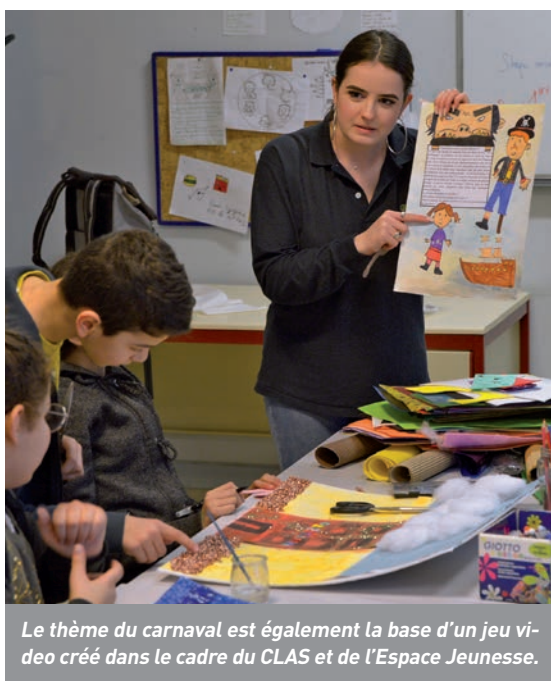
Le thème du carnaval est également la base d'un jeu vidéo créé dans le cadre du CLAS et de l'Espace Jeunesse.