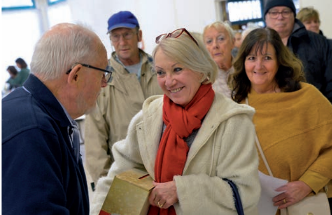
Des colis pour les personnes âgées et des chèques ont été distribués, sous conditions de ressources, à l'occasion des fêtes de Noël, autour de moments conviviaux.