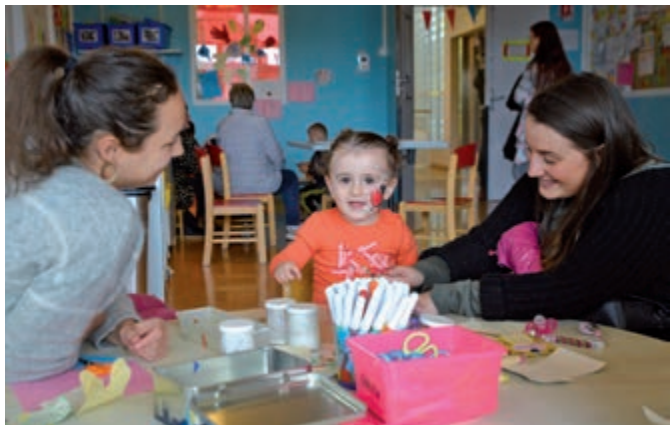
La Fête de la petite enfance a permis aux enfants comme aux parents de s'éclater !