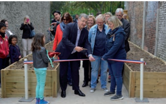
Inauguration, le 18 mai, rue Lafargue, des jardins de Saint-Pierre, mis à disposition des habitants du quartier.