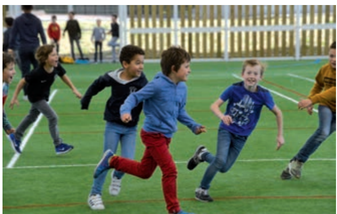
La pause méridienne est un temps bien occupé. Ici le tournoi de football inter-écoles !