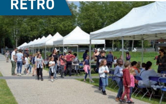
De nombreux stands ont vanté le développement durable lors de la journée du 25 mai dans les jardins Mallet-Stevens.