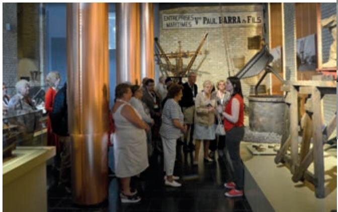
Visite du musée portuaire de Dunkerque, suivi d'un repas dansant, pour cette édition 2019 du voyage des aînés.