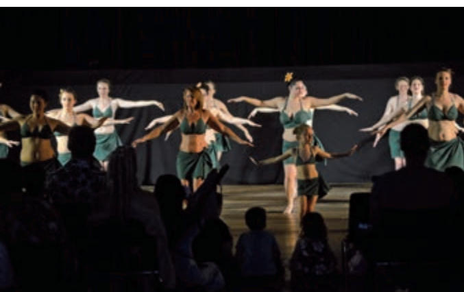
L'association Heiporinetia a trouvé son public : superbe gala le 1 er juin !