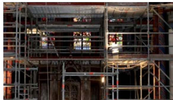
Intérieur de l'église. Échafaudages dans le chœur