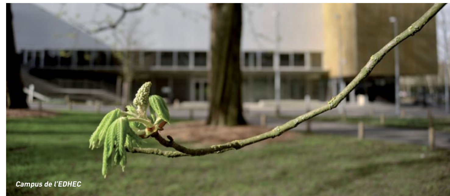
Campus de l'EDHEC