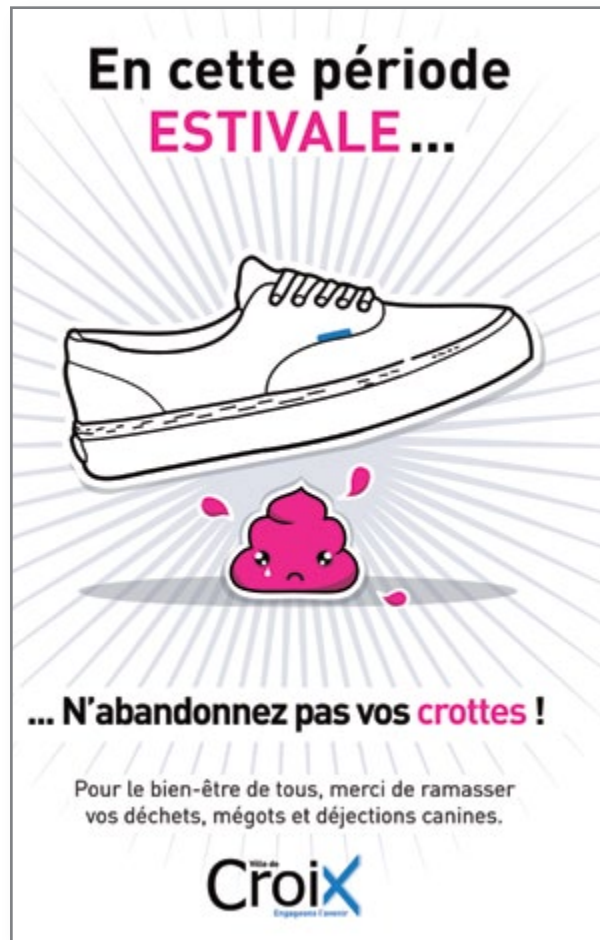
Affiche de la campagne municipale «propreté» - juin 2014.