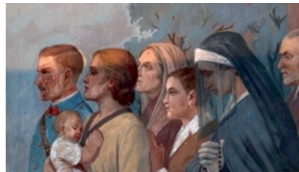
Pèlerinage à N-D de Délivrance