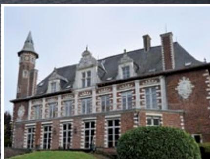
Dossier spécial : journées du patrimoine