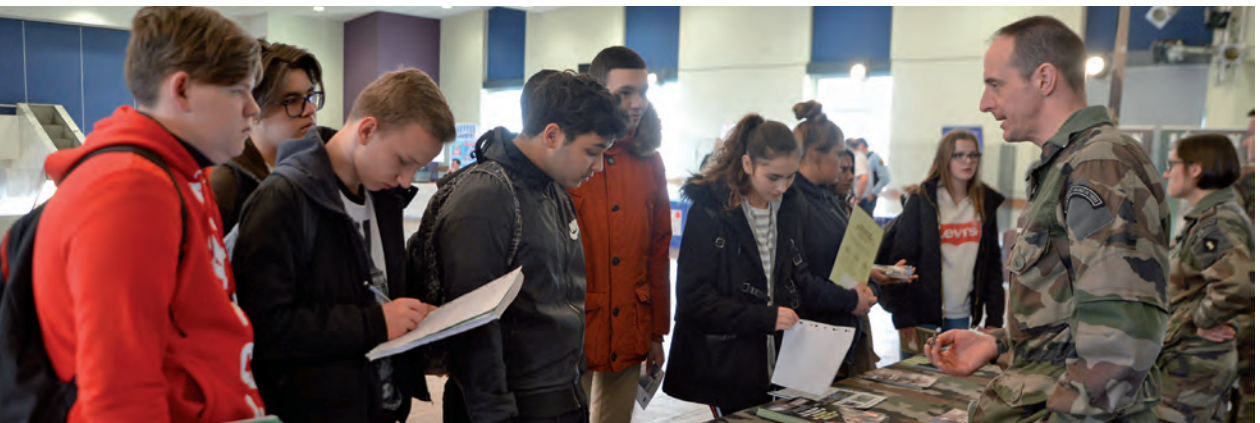
Les jeunes désireux d'en savoir plus sur les métiers des corps d'armée ont pu rencontrer le Centre d'Information et de Recrutement des Forces Armées ainsi que de nombreux autres représentants de ce secteur lors d'un forum le 21 mars.