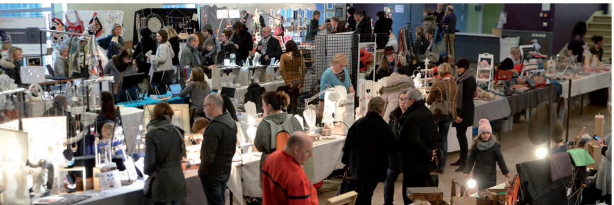
Les 17 et 18 mars, le public s'est laissé tenter par les créations originales et personnalisées de la soixantaine d'exposants du 2 e salon des créateurs et de l'artisanat.