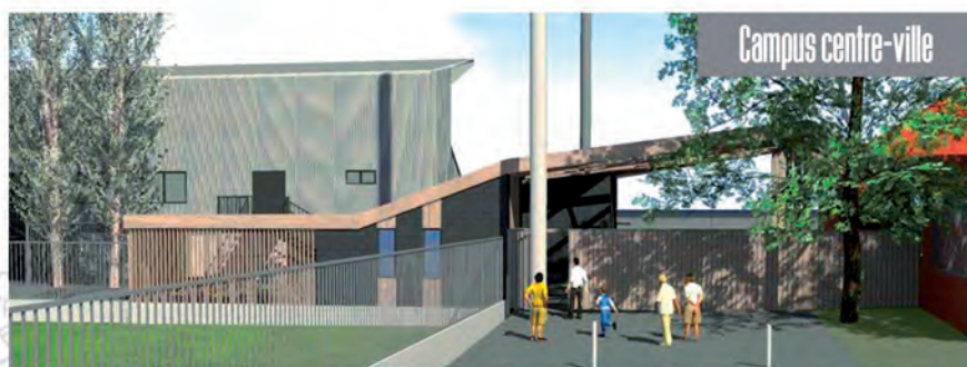
début des travaux en avril 2018 / Livraison en janvier 2019

Nous tenons parole pour bâtir l'avenir !