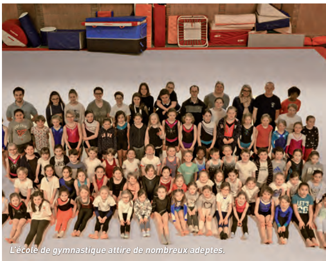
L'école de gymnastique attire de nombreux adeptes.

La Patriote de Croix - Rue Eugène Guillaume (salle Sandras) Informations auprès de Hocine Sadsaoud au 06 69 16 61 99