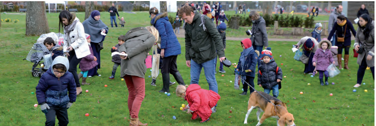
Une grande chasse aux œufs de Pâques était organisée dans les Jardins Mallet-Stevens pour les petits Croisiens, samedi 31 mars. Ces derniers s'en sont donnés à cœur joie !