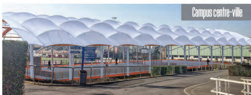
début des travaux en avril 2018 / Livraison en septembre 2018