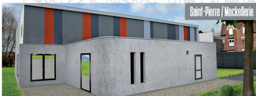
Inauguration le 16 juin 2018