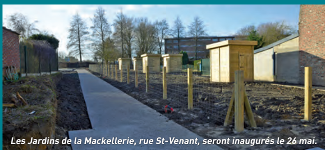
Les Jardins de la Mackellerie, rue St-Venant, seront inaugurés le 26 mai.