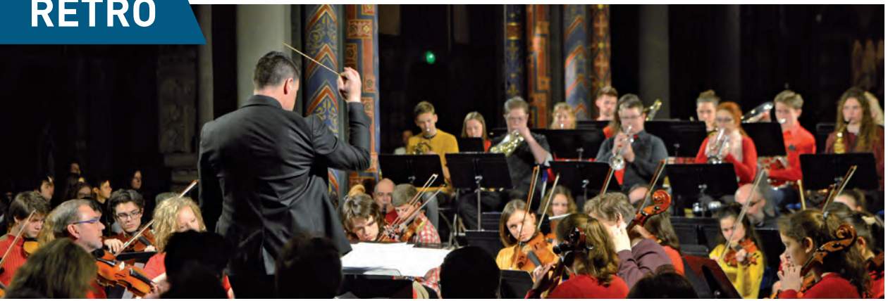
L'orchestre à cordes intercommunal Trifolies (Croix, Mons en Barœul et Wasquehal), a donné son concert annuel le 23 mars dernier. Il était placé sous le thème des « Amériques ».