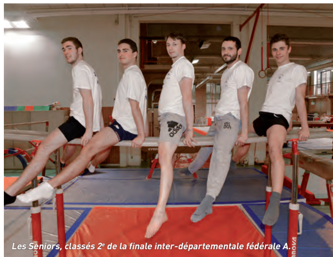
Les Seniors, classés 2 e de la finale inter-départementale fédérale A.