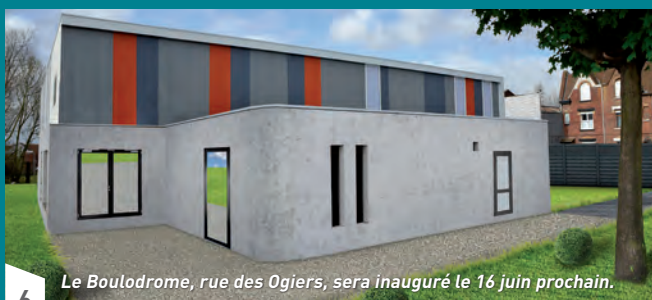
Le Boulodrome, rue des Ogiers, sera inauguré le 16 juin prochain.