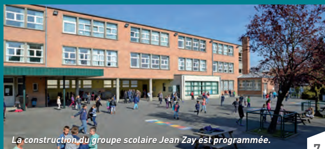
La construction du groupe scolaire Jean Zay est programmée.