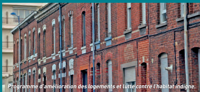
Programme d'amélioration des logements et lutte contre l'habitat indigne.