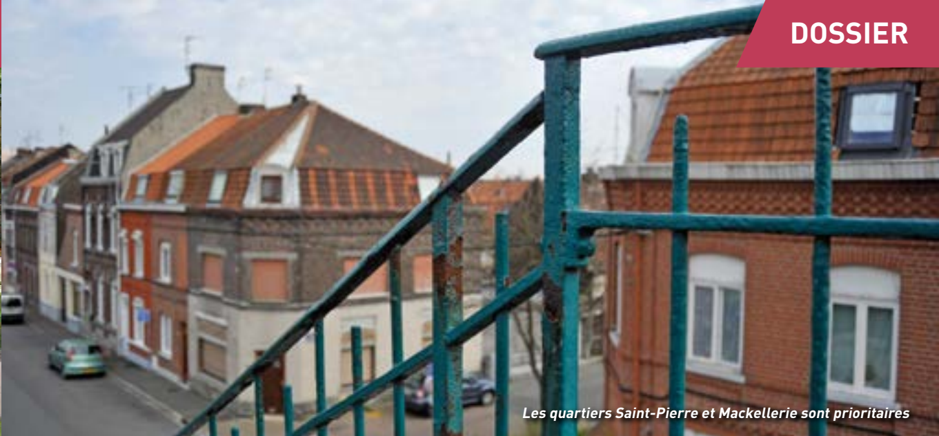
Les quartiers Saint-Pierre et Mackellerie sont prioritaires