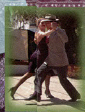
Tango ? Tango !