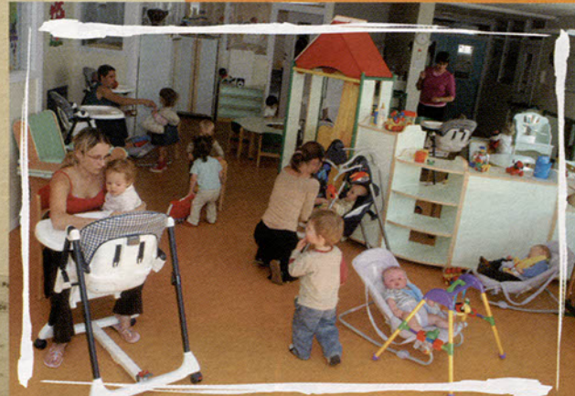
La crèche "Galipette"