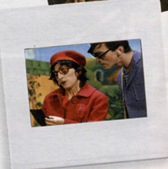
"La fanfare du bout du monde"