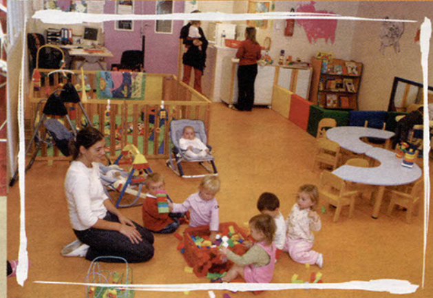
La halte-garderie "Bout'Chou"