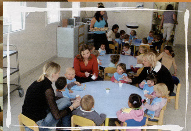
La salle de repas