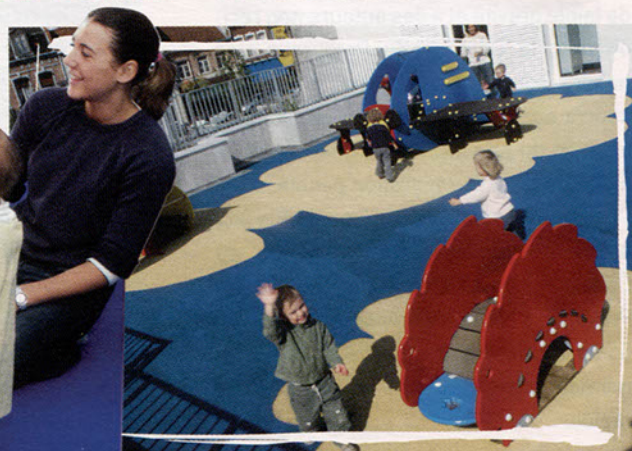
L'aire de jeux en terrasse