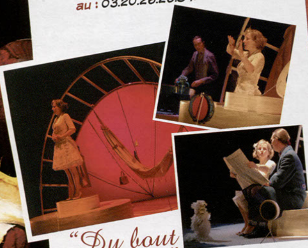
"Du bout des doigts"

Renseignements et réservations au : 03.20.26.26.84.