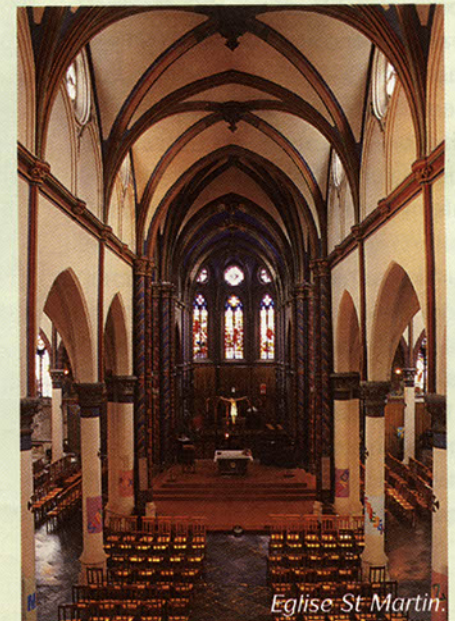
Eglise St Martin.