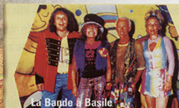
La Bande à Basile