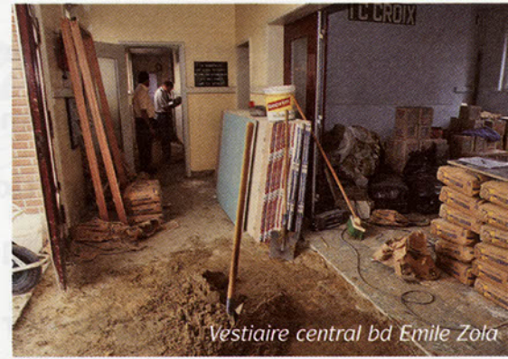
Vestiaire central bd Emile Zola