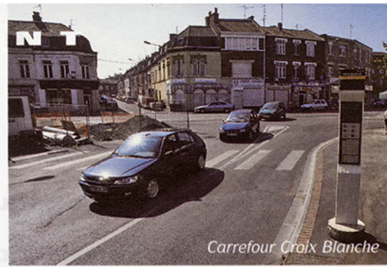
Carrefour Croix Blanche

Parallèlement, des travaux d'entretien confortent des bâtiments communaux : réfection de toitures, travaux dans les écoles ou au P.A.E.