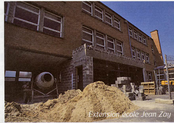
Extension école Jean Zay