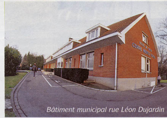
Bâtiment municipal rue Léon Dujardin