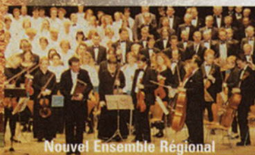
Nouvel Ensemble Régional