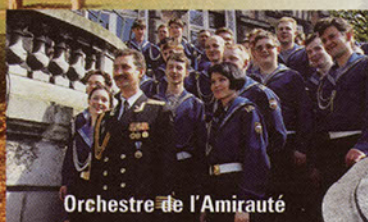
Orchestre de l'Amirauté