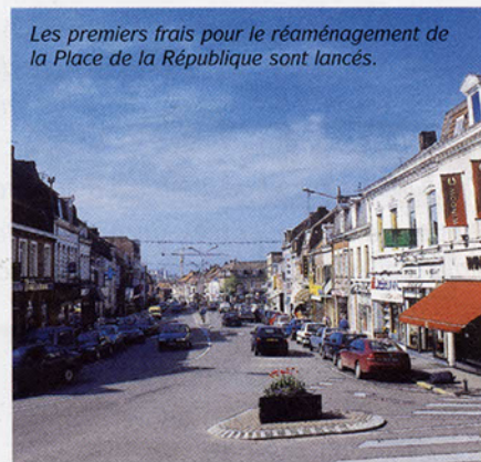
Les premiers frais pour le réaménagement de la Place de la République sont lancés.