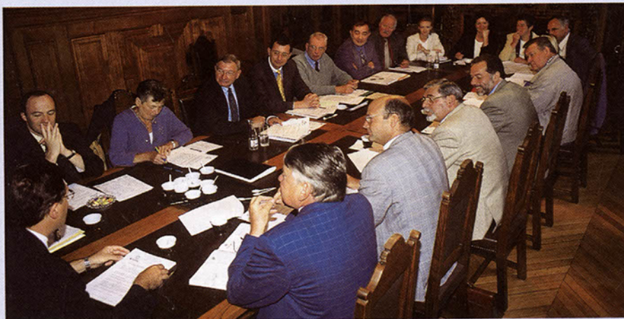
Les élus des communes citées débattent du projet.

A Croix donc, la PAIO maintiendra ses portes ouvertes au 161, rue Kléber tout comme le PAE (point accueil emploi) au 16, place de la République. La nouvelle structure sera gérée par un conseil d'administration comprenant des élus représentant les villes, des représentants des institutions administratives, des partenaires économiques et sociaux, des représentants des associations et organismes de formation. Elle prendra effectivement place après l'accord de l'Etat, attendu dans le courant du premier semestre de l'année prochaine.