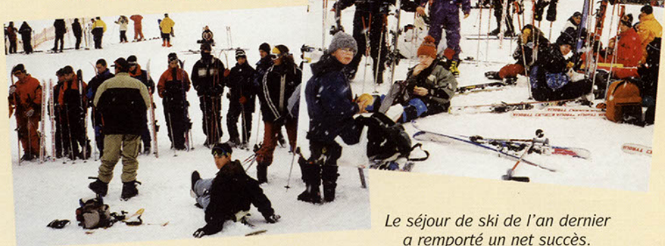
Le séjour de ski de l'an dernier a remporté un net succès.