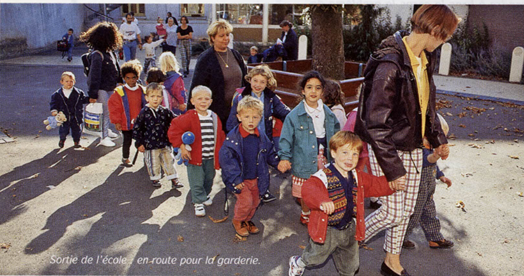
Sortie de l'école, en route pour la garderie.

Situé au rez-de-chaussée du 19 rue de la Gare (dont le premier étage est occupé par Croix Enfance et Famille, crèche familiale de Croix), le LCR propose une halte garderie dénommée les " Mini Pouces ", ouverte à tous les enfants de 3 mois à 6 ans, du lundi au vendredi. L'atelier d'éveil est réservé aux 2-3 ans non scolarisés afin de les préparer pour l'entrée à l'école maternelle. Les enfants sont accueillis chaque matin en petits groupes pour des activités bien spécifiques. Celles-ci favorisent l'expression, les relations et la vie en collectivité.