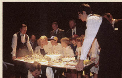
Bon anniversaire, la MJC.

Il y aura à la fois des épreuves phy- siques, techniques, intellectuelles et artistiques, le but étant de réunir le maximum d'indices permettant de trou- ver la formule magique finale. Ce jeu se jouera par équipes de quatre (maxi- mum 9 équipes) qui auront à passer des épreuves dans les différentes pièces