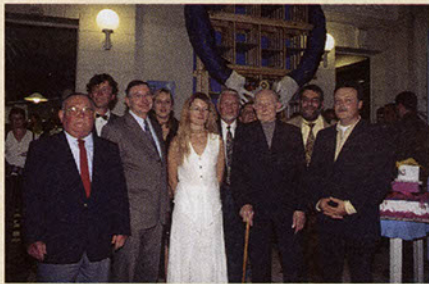
Inauguration des 50 ans

Un parfum avec trois générations, de multiples personnages, des valises et des chansons... Emotions et sourires au rendez-vous.