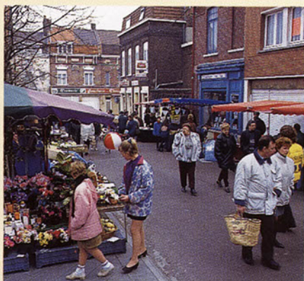
3 semaines d'animations sur les marchés.