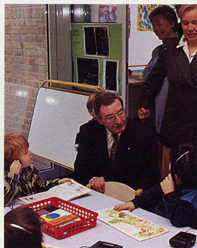
Le 27 janvier, lors de l'inauguration de l'école Pasteur.