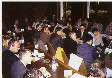
Réunion intercommunale à Croix.