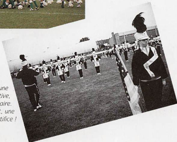
Le tournoi est, au delà d'une formidable compétition sportive, une grande fête populaire. Il démarre par un concert, une grande parade et un feu d'artifice !