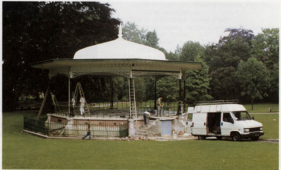
Coup de jeunesse pour le kiosque qui grâce aux nombreux travaux qui lui ont été consacrés retrouve, en cette fin du mois de juin, sa vocation et dote le parc d'un équipement typique.

Bien ancré au cœur d'un écrin de verdure et grâce aux 400.000 F de travaux qui lui ont été consacrés, le kiosque, situé dans le parc de la mairie, retrouve sa pleine vocation.