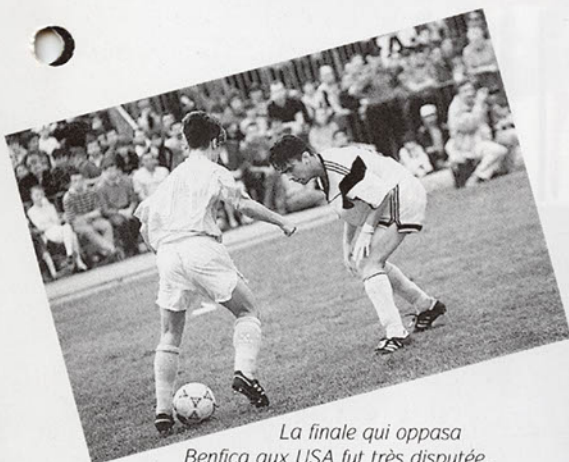
La finale qui opposa Benfica aux USA fut très disputée. L'affiche souleva l'enthousiasme du public.

Le 36 e tournoi a remporté un vif succès.