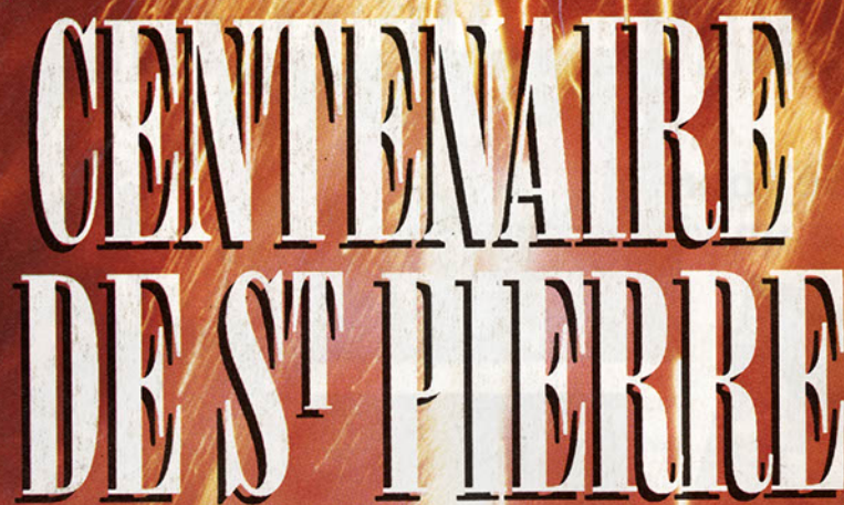
Photo souvenir du centenaire de l'église St Pierre