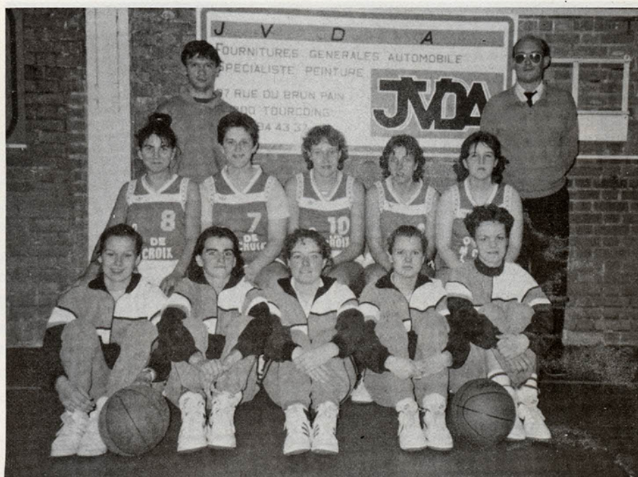
Equipe SENIORS 1 FILLES - OLYMPIQUE CROIX Entraîneur : P. ZMIJAK

Inutile de préciser que les entraîneurs (J.B. GILLIET pour les garçons, B. POTIER et P. ZMIJAK pour