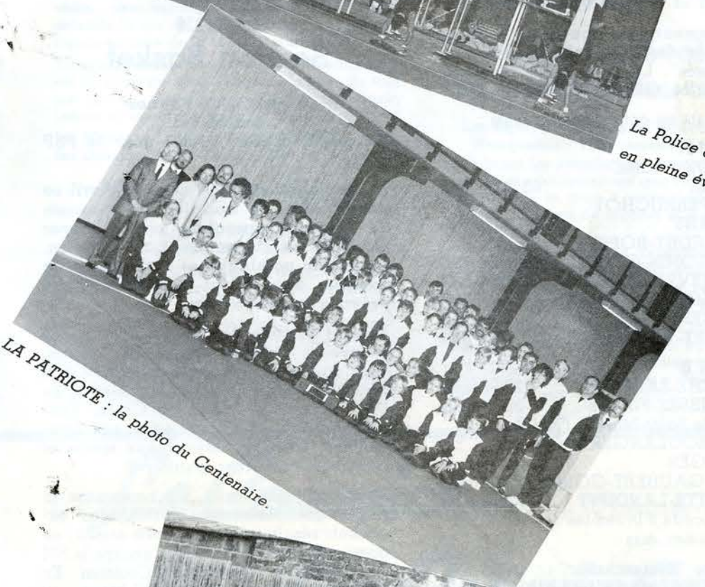
LA PATRIOTE : la photo du Centenaire.