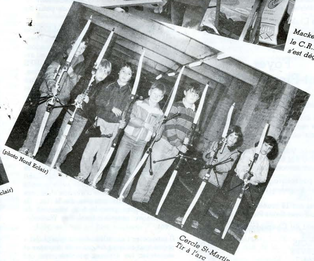
Cercle St-Martin Tir à l'arc