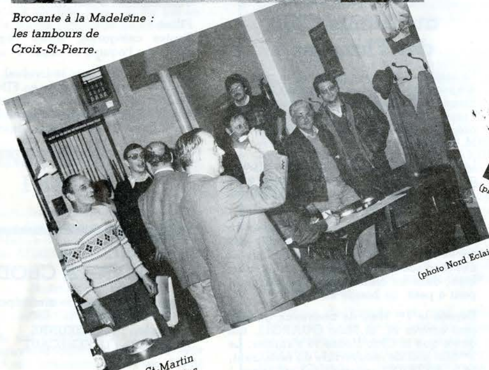
Cercle St-Martin Jeu de fléchettes