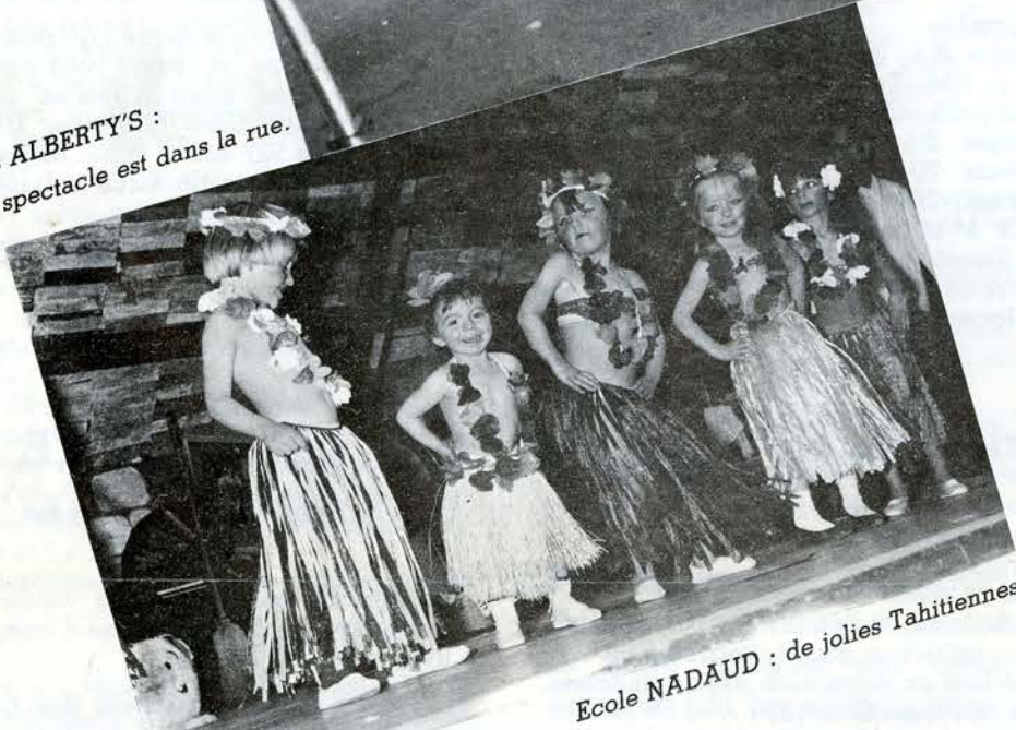
Ecole NADAUD : de jolies Tahitiennes.