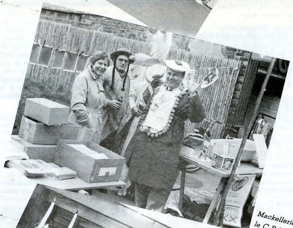
Mackellerie : le C.R.I. s'est déguisé.