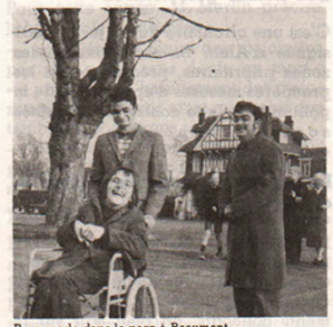
Promenade dans le parc à Beaumont.

Depuis 1968, dans le magnifique parc de Beaumont (rue Winston-Churchill) 35 filles et garçons se retrouvent chaque samedi de 14 h à 18 h, l'animation est assurée par quelques parents et jeunes qui consacrent une partie de leurs loisirs au bénéfice de leurs amis handicapés.