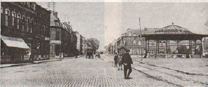
Croix, rue de la Gare et le kiosque.