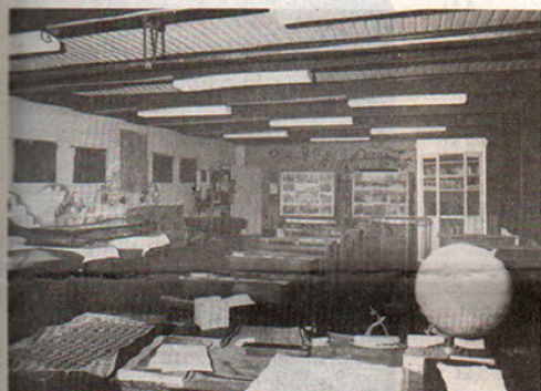
La classe d'époque reconstituée.