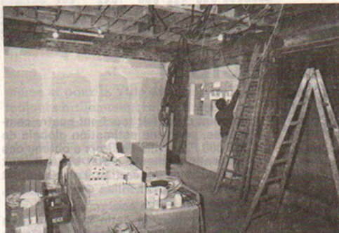
Salle de réunion de la rue Jules-Guesde en construction, elle pourra accueillir une quarantaine de personnes.

Quant à ce vandalisme... Détruire un appareil doit être considéré comme un acte criminel. Certaines personnes en difficulté soit malades, soit accidentées peuvent parfois rester sans secours à cause de cela. Il est utile de l'apprendre aux enfants. Les cabines sont notre bien à tous et nous avons le devoir de faire ce qui est en notre pouvoir pour les protéger.