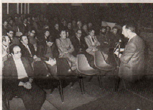
Monsieur le Maire devant les présidents des associations locales.