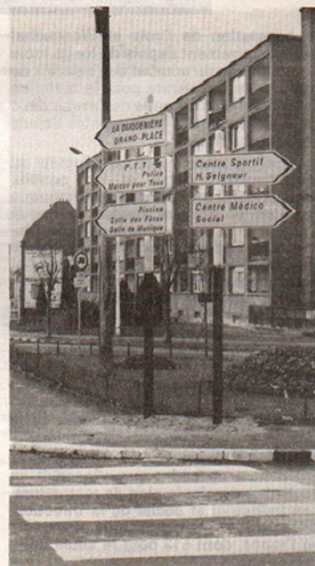
Panneaux directionnels récemment implantés.

Dans le courant du mois de janvier, les Croisiennes et les Croisiens ont pu remarquer que Croix, à l'instar de ses voisins, affirmait sa volonté d'accueil car de nombreux panneaux directionnels ont été implantés. Ainsi, les automobilistes qui viendront visiter notre ville pourront se diriger plus facilement à travers les différents quartiers. Il faut souligner ici l'effort de la Communauté Urbaine de Lille qui, à l'initiative de la Municipalité, a permis la réalisation de