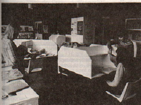
Salle CDI au collège B. Vian.