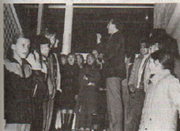
Les enfants du collège interprétant la Marseillaise lors de l'inauguration.

Les Présidents des Associations Locales furent, quant à eux, accueillis le jeudi 14 janvier dernier en la salle des fêtes de la rue Jean-Jaurès. Après avoir, à cette occasion, exprimé son sentiment de satisfaction, quant au développement croissant de la vie associative croisienne, M. le Maire, au cours de son allocution souligna la